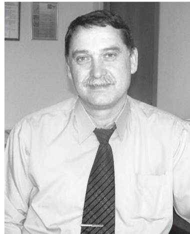
К пенсии нужно подходить взвешенно

В рамках системы обязательного пенсионного страхования между НПФ и ПФР есть существенная разница. Взносы на накопительную часть пенсии поступают на индивидуальные пенсионные счета граждан в ПФР, который размещает эти средства по «умолчанию» через государственную управляющую компанию, Внешэкономбанк, инвестирующий в основном в государственные ценные бумаги - надёжные, но низкодоходные. По закону, ВЭБ не может выходить с деньгами так называемых «молчунов» на открытый фондовый рынок.